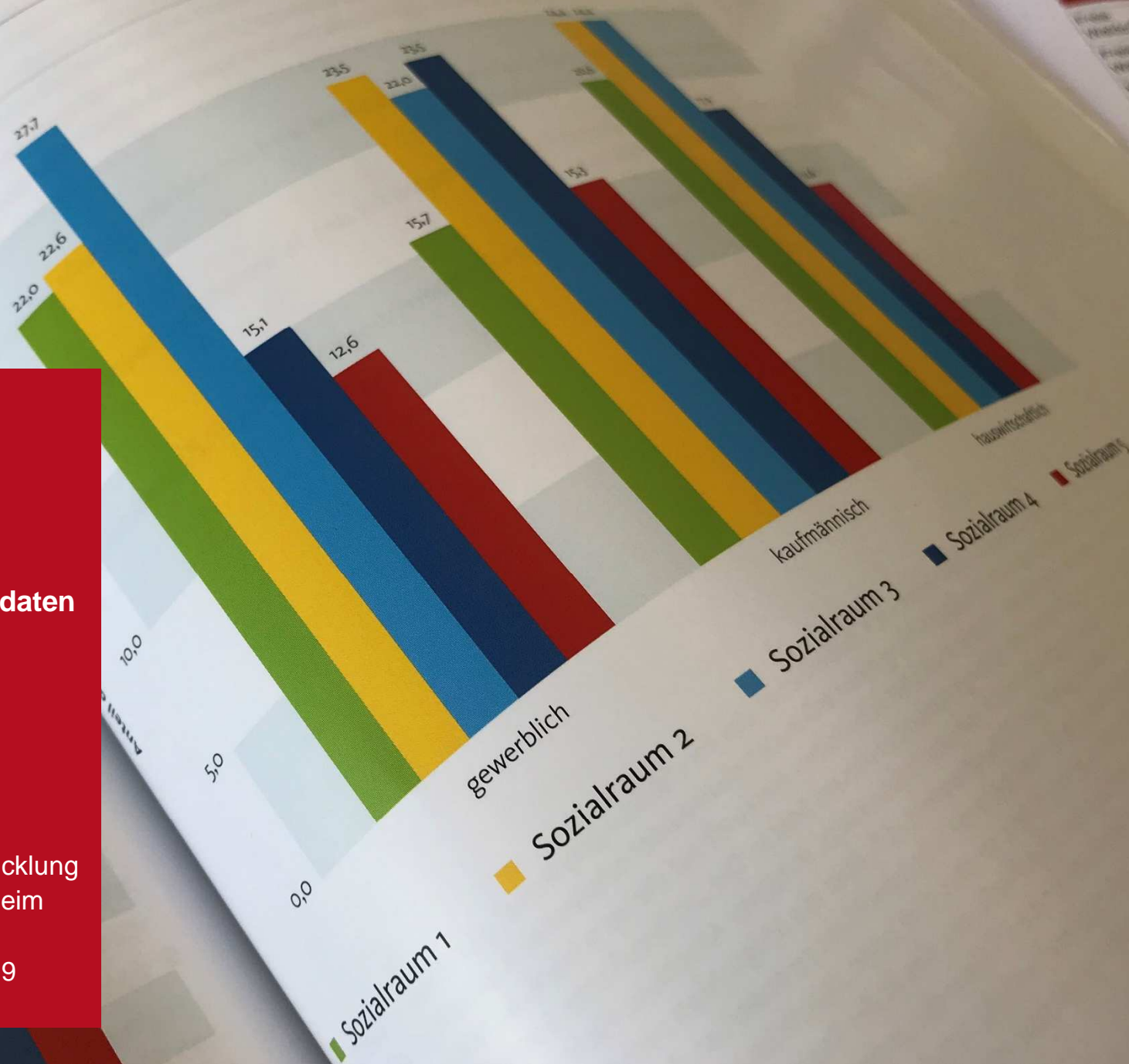
Prozentuale Verteilung der Mannheimer Schillerschule in beruflichen Gymnasien zu den Sozialräumen 1 bis 5